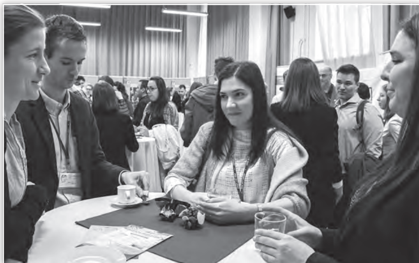
A konferencia kávészünetei – a szakmai eszmecserék alkalmai