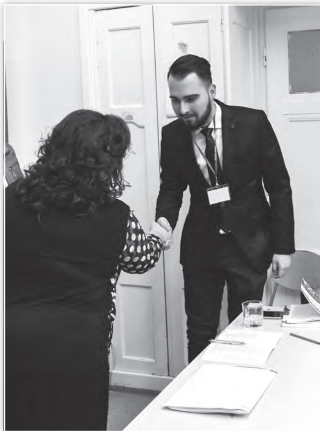
Részvevői oklevél átadása az Emberi erőforrás tanácsadás és felnőttképzés tagozati ülésen