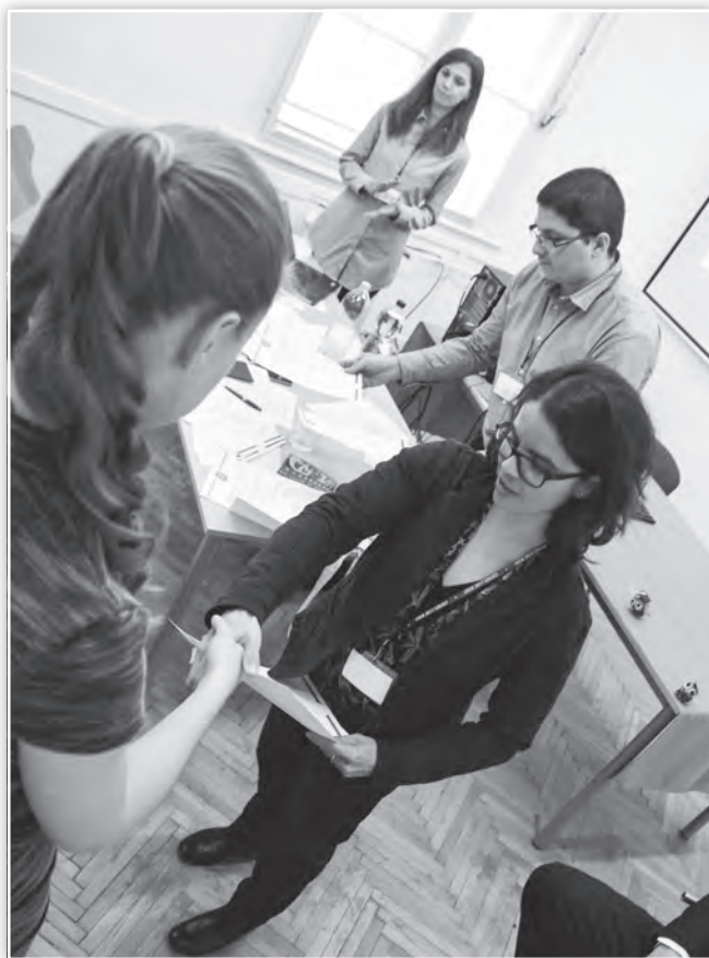
Résztevői oklevél átadása a Szociálpszichológia tagozati ülésen