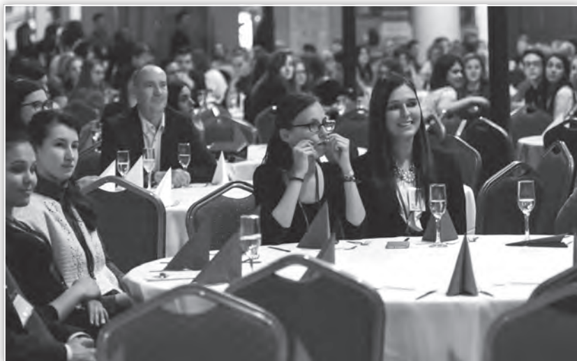
A konferencia fogadása az SZTE József Attila Tanulmányi és Információs Központban