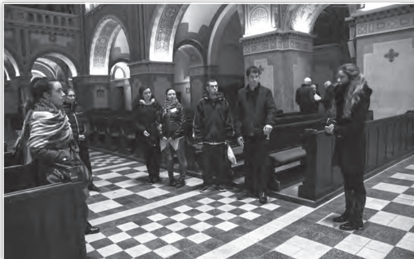
Látogatás a Szegedi dómban – a konferencia kulturális programja