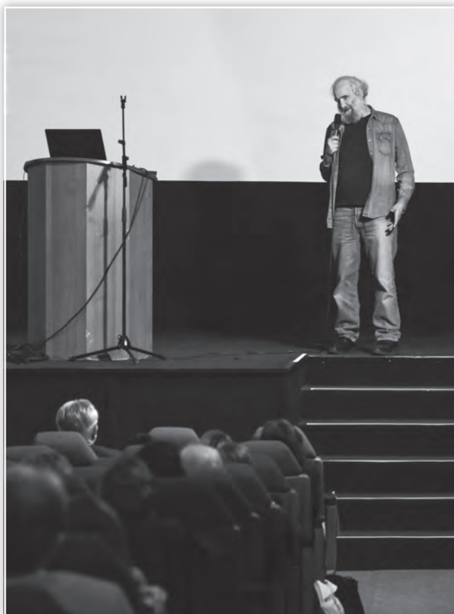
Prof. dr. Mérő László előadása a konferencia megnyitóján