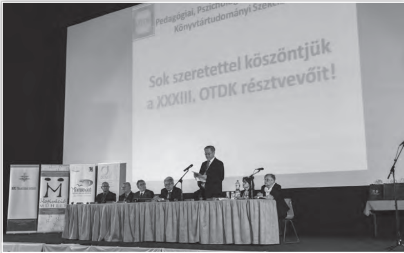
Az OTDT 13. Szakmai Bizottság elnökének értékelő beszéde a konferencia záró ünnepségén