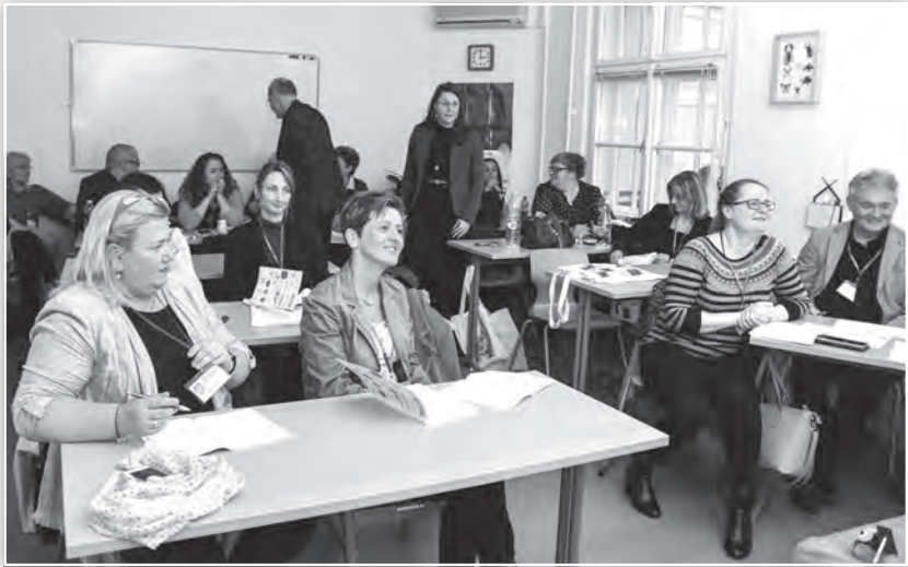
A Nevelés- és pedagógiatörténet tagozat ülése