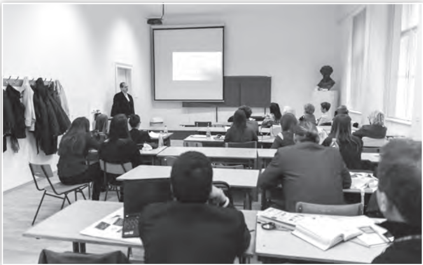
Előadás a Gyermekvédelem, neveléstudomány és nevelésfilozófia tagozatban