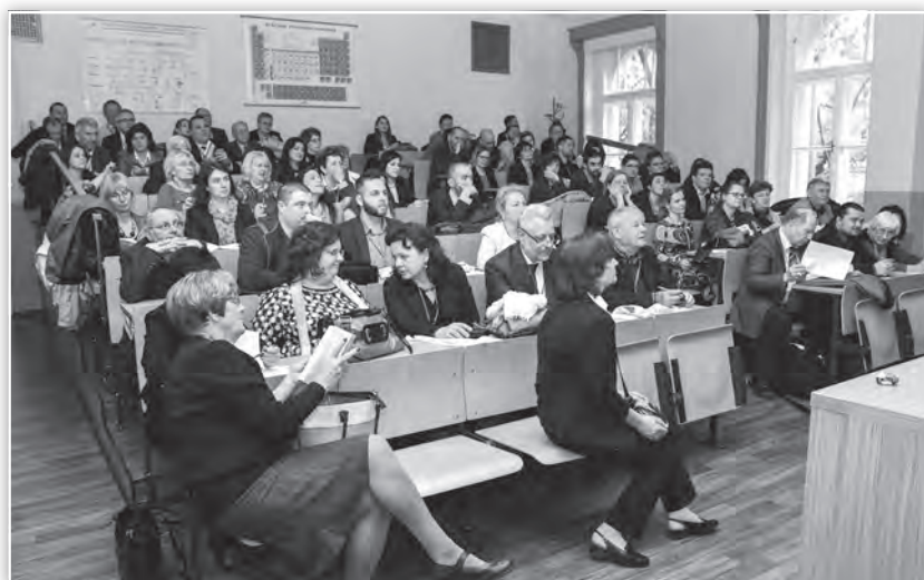
A tagozati zsűritagok értekezlete