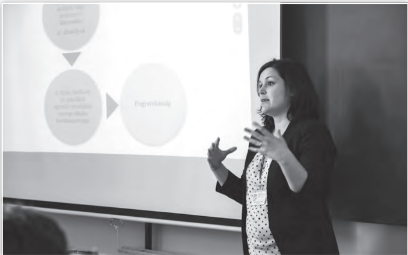
Előadás az Emberi erőforrás tanácsadás és felnőttképzés tagozat ülésén