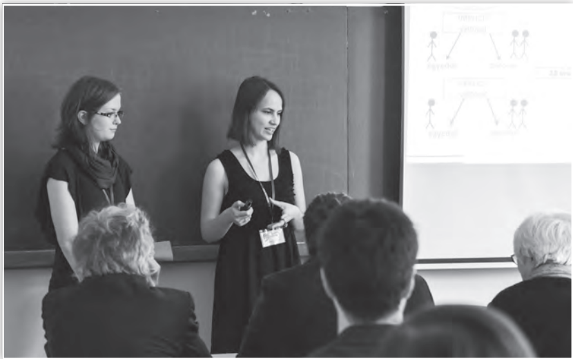
Az Általános lélektan 1. tagozat ülése