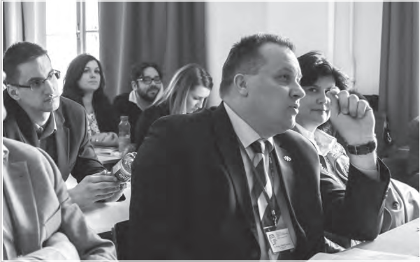
Zsűri értékelés az Emberi erőforrás tanácsadás és felnőttképzés tagozat ülésén