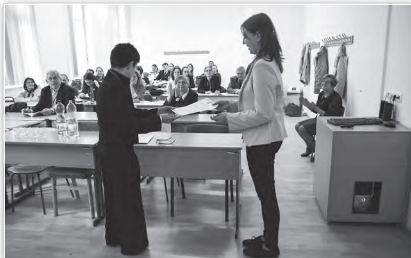
A résztvevői OTDK Emléklap átadása a Kultúra és közösség tagozatban