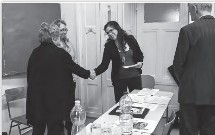
Részvevői oklevél átadása a Felnőttképzés tagozat ülésén