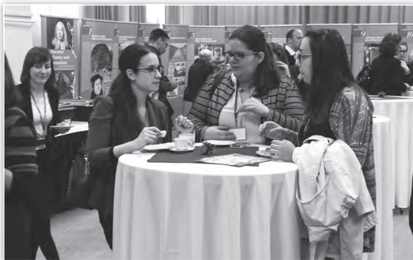
Szakmai eszmecsere a konferencia kávészünetében