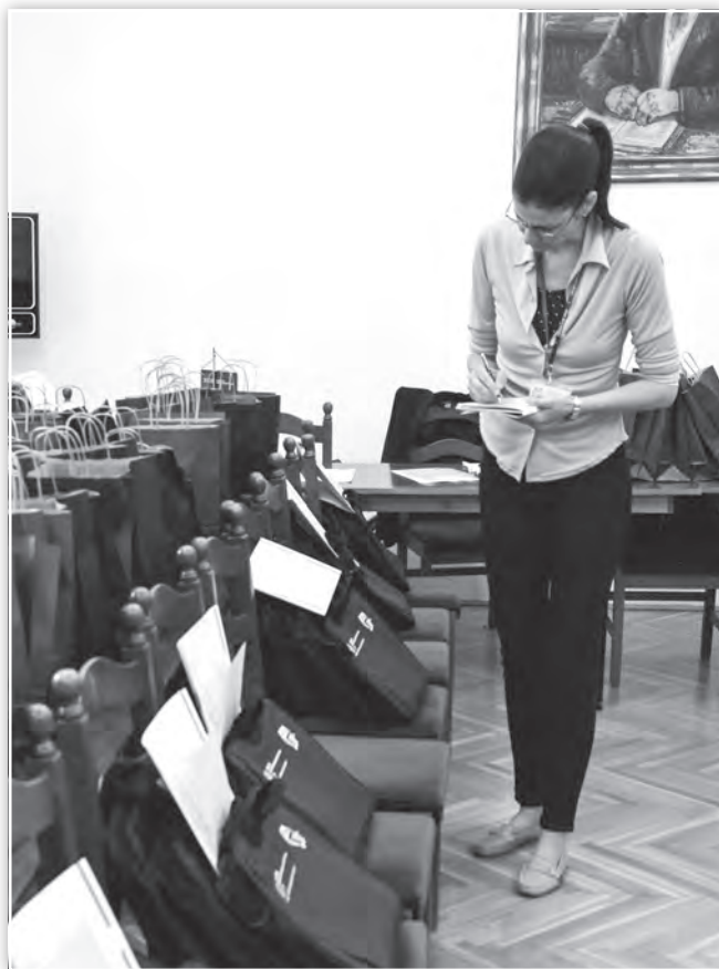
OTDK szervezői háttérmunka a díjak és zsűri ajándékok rendszerezése