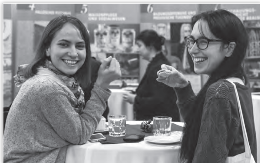
A konferencia kávészünetei – a lazítás pillanatai