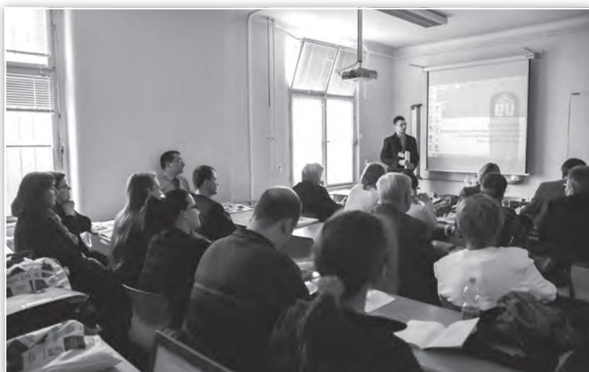
Előadás a Művelődés- és könyvtártörténet tagozat ülésén