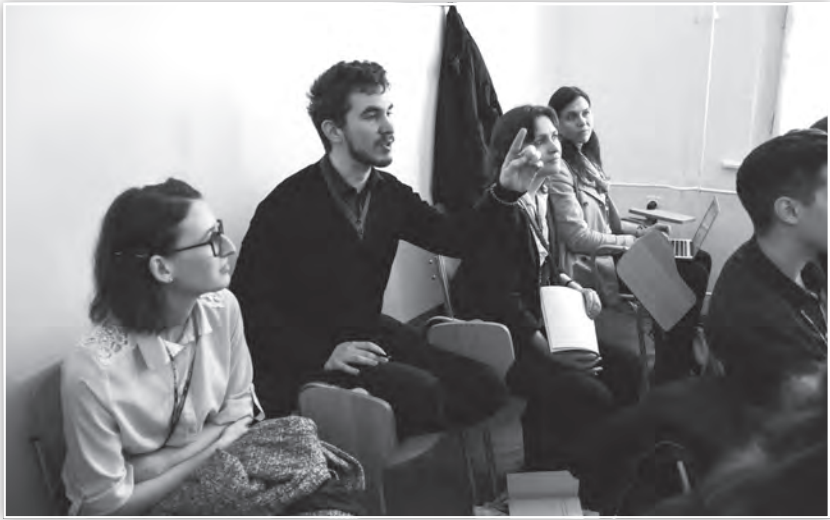
Hozzászólás a Szociálpszichológia tagozat ülésén