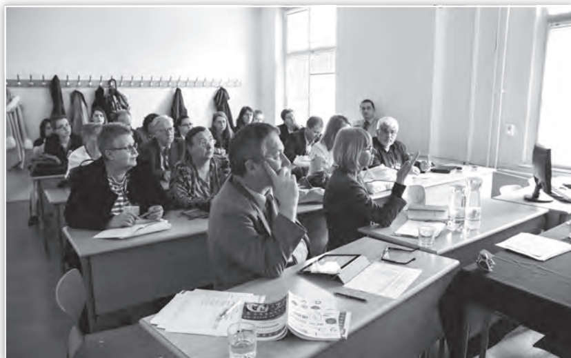
A zsűri szakmai értékelése a Művelődés- és könyvtártörténet tagozat ülésén