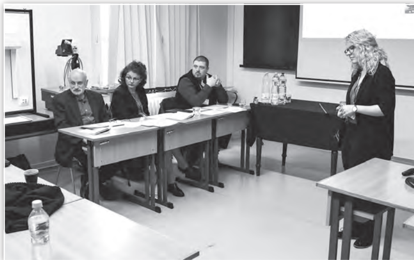
Az Alkalmazott pszichológia 2. tagozat ülése