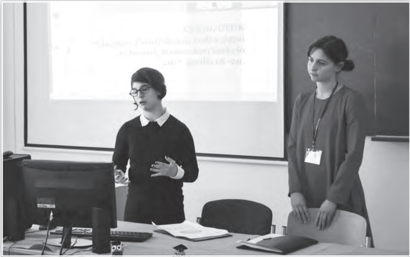
Előadás a Szociálpszichológia tagozat ülésén