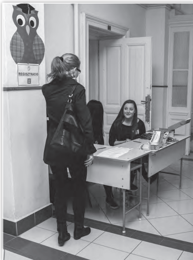
A konferencia regisztrációs pontja