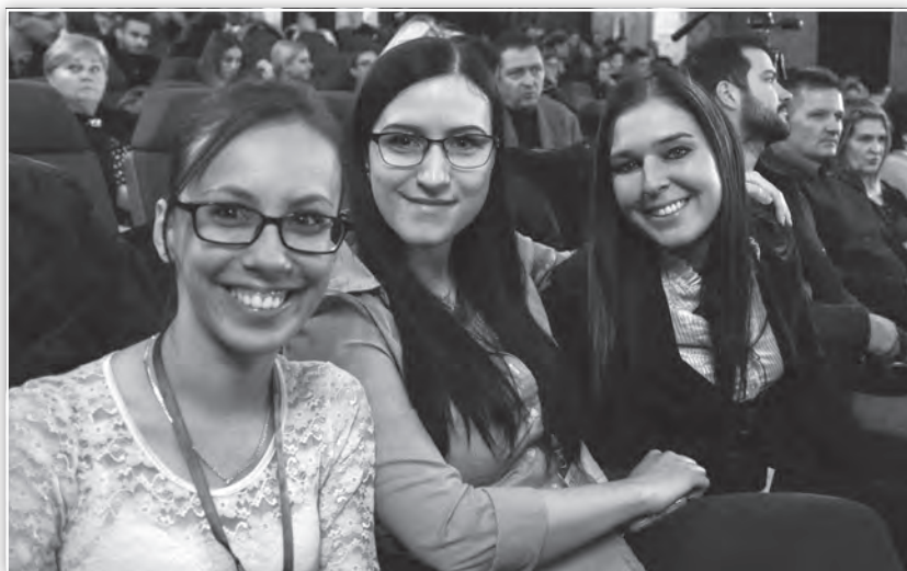
A záró ünnepség izgatott közönsége