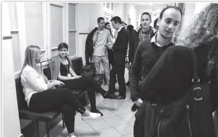
Tagozati szakmai értékelésre várva