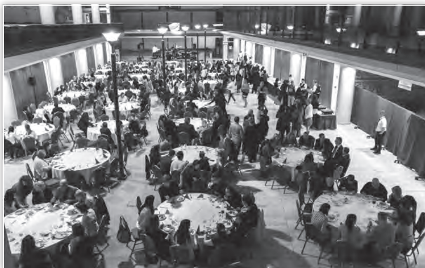
A konferencia fogadása az SZTE József Attila Tanulmányi és Információs Központban