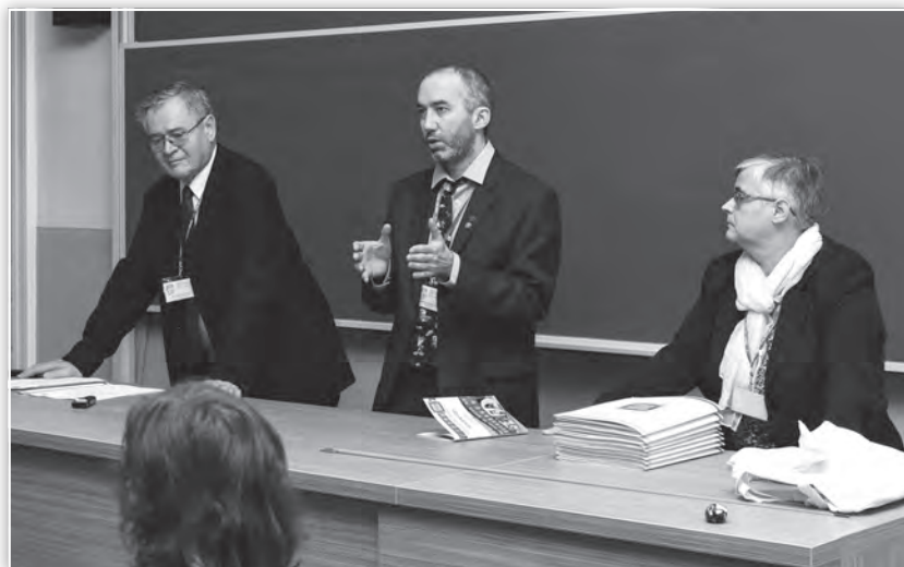
Tájékoztatás az OTDK tagozati zsűriük értekezletén