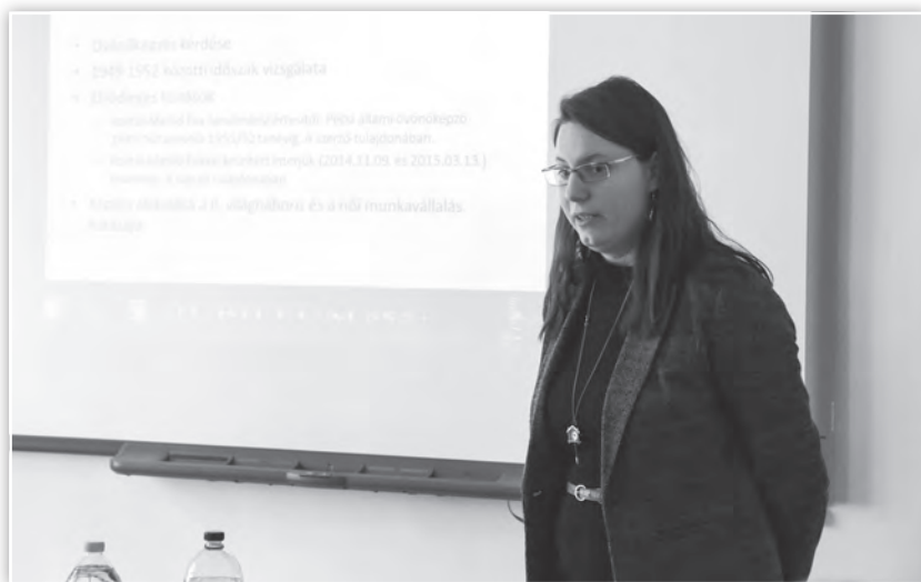
Előadás a Nevelés- és pedagógiatörténet tagozat ülésén