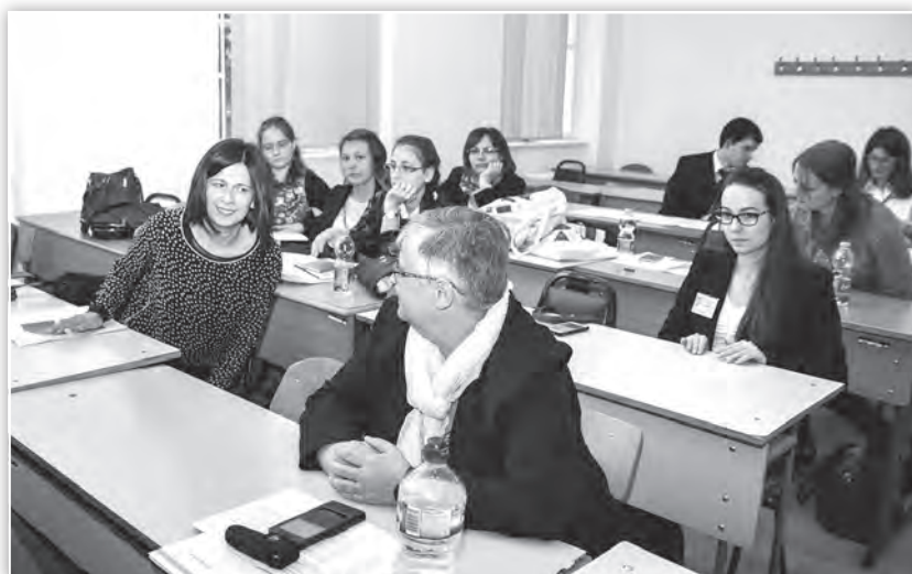
A Kultúra és közösség tagozat ülése