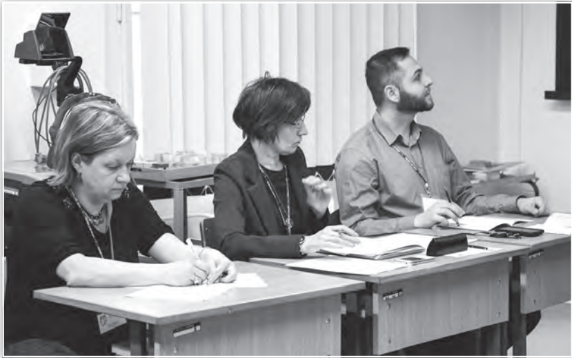
A zsűri kérdez és értékel az Alkalmazott Pszichológia 1. tagozat ülésén