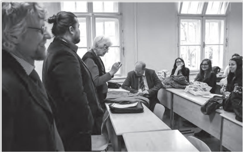
A zsűri szakmai értékelése az Általános lélektan 1. tagozat ülésén