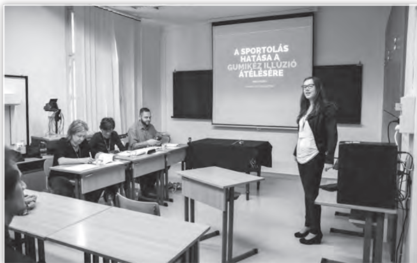
Az Alkalmazott pszichológia 1. tagozat ülése