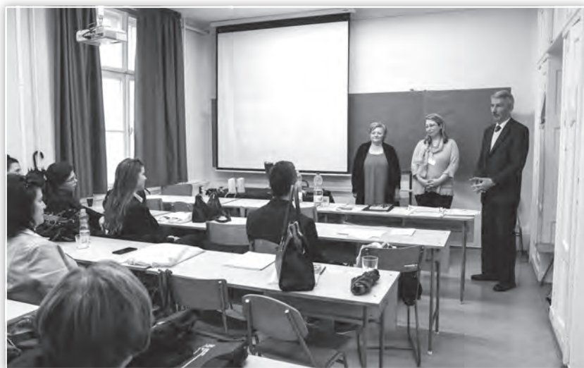
A zsűri szakmai értékelése a Felnőttképzés tagozat ülésén