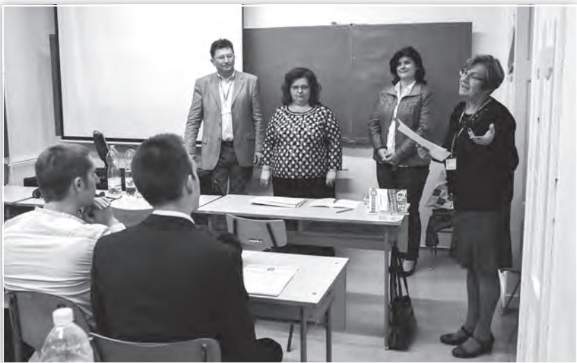
OTDT emléklap kiosztása az OTDK diák és oktató résztvevői számára az Emberi erőforrás tanácsadás és felnőttképzés tagozati ülésén