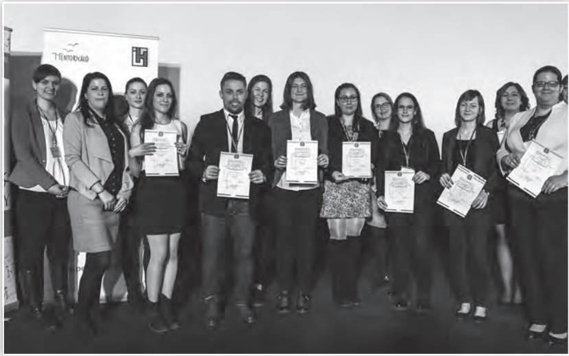
Díjazottak és oktatók az OTDK 13. szekciójának záró ünnepségén