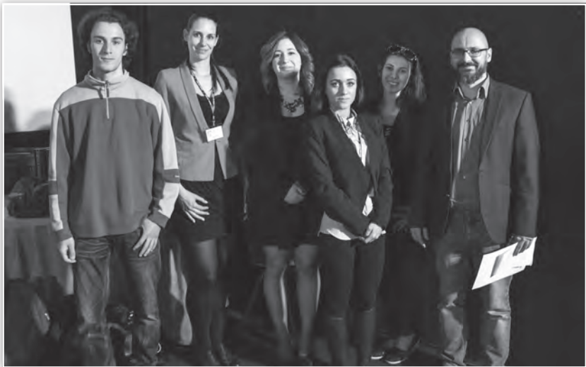
A Motiváció Műhely különdíjainak átadása az esélyegyenlőség, társadalmi integráció témakörében készített kiemelkedő TDK dolgozatok elismeréseként