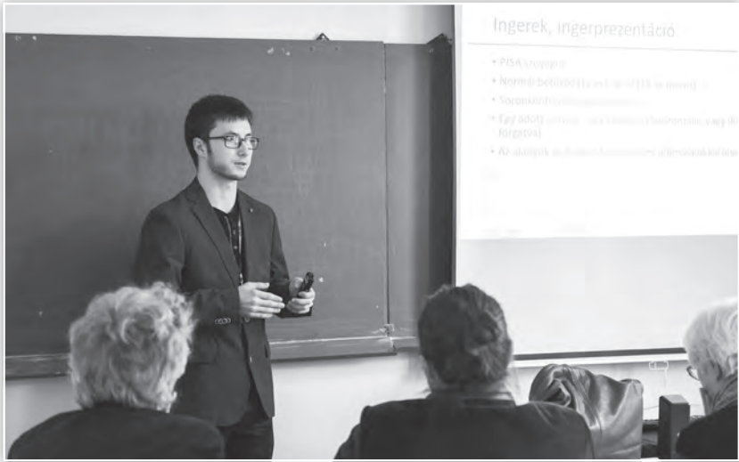
Előadás az Általános lélektan 1. tagozat ülésén