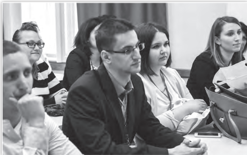
Az Emberi erőforrás tanácsadás és felnőttképzés tagozat résztvevői