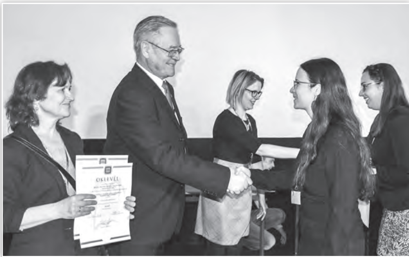
Oklevelek átadása a díjazottaknak