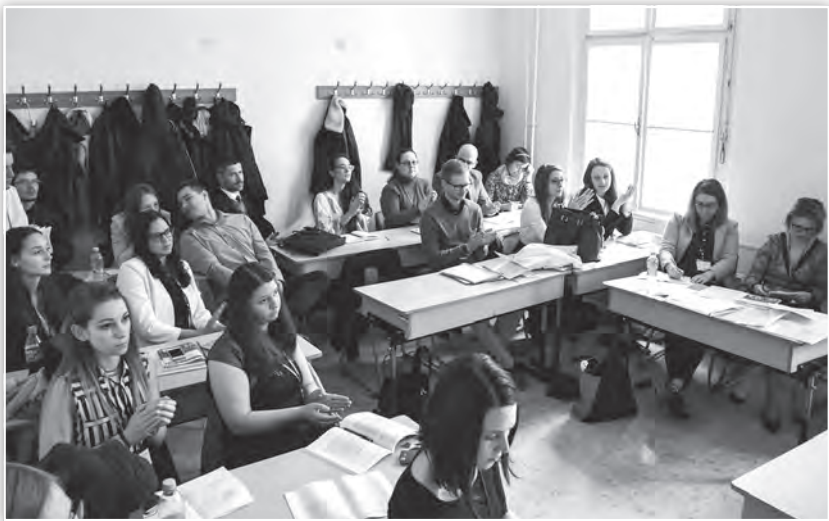
A Fejlesztéslektan 1. tagozat ülése