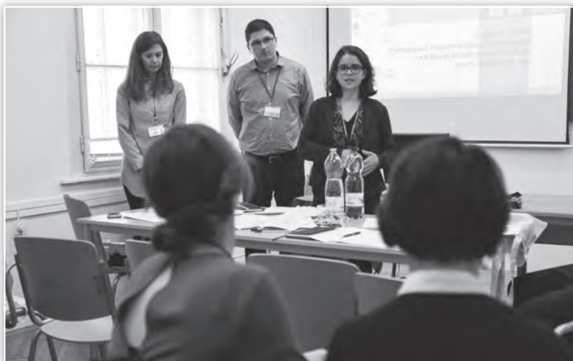
A Szociálpszichológia tagozat zsűrijének értékelése