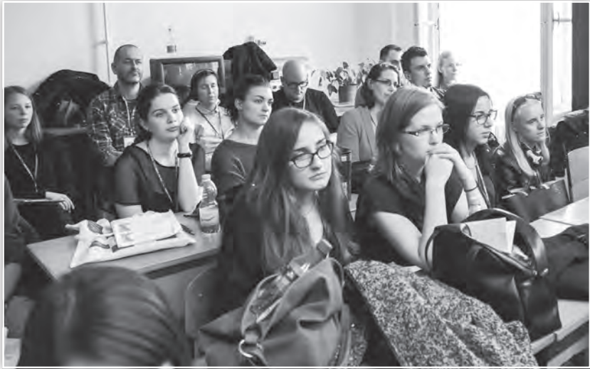
Az Alkalmazott pszichológia 1. tagozat közönsége